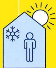
RESTEZ AU FRAIS