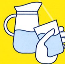
BUVEZ DE L'EAU